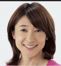
マラソンランナー 谷川 真理 Mari Tanigawa