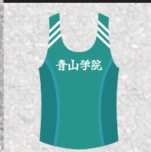
第101回 箱根駅伝 総合優勝 (2連覇) 青山学院大学 陸上競技部